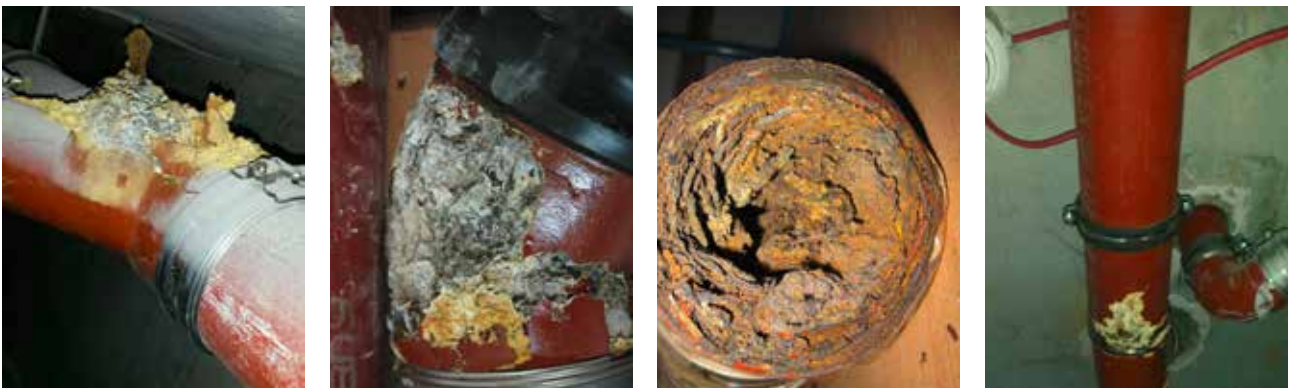
Marode und zerschlissene Rohre im Bereich des Wasser- und Abwassersystems.

Die bereits begonnen und dringend notwendigen Arbeiten gehen in den 2. Bauabschnitt. Nachdem im vergangenen Jahr im Umfeld der Bühne im Großen Haus saniert wurde, geht es in diesem Sommer um den Bereich der Garderoben sowie um die Entwässerungsleitungen zwischen der 2. und 4. Etage. Dort werden bis zum Beginn der neuen Spielzeit im Großen Haus alle maroden und verschlissenen Rohre (siehe Fotos) ausgetauscht und die Sanitärinstallation erneuert. Es wird mit einer Bauzeit von 9 Wochen (incl. der DomStufen-Festspielzeit) gerechnet. Die Kosten in Höhe von bis zu einer halben Million trägt überwiegend das Land Thüringen.