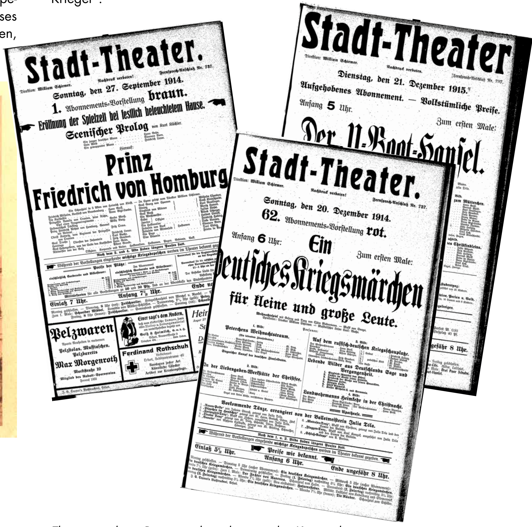
Theaterzettel von Propagandastücken aus den Kriegsjahren